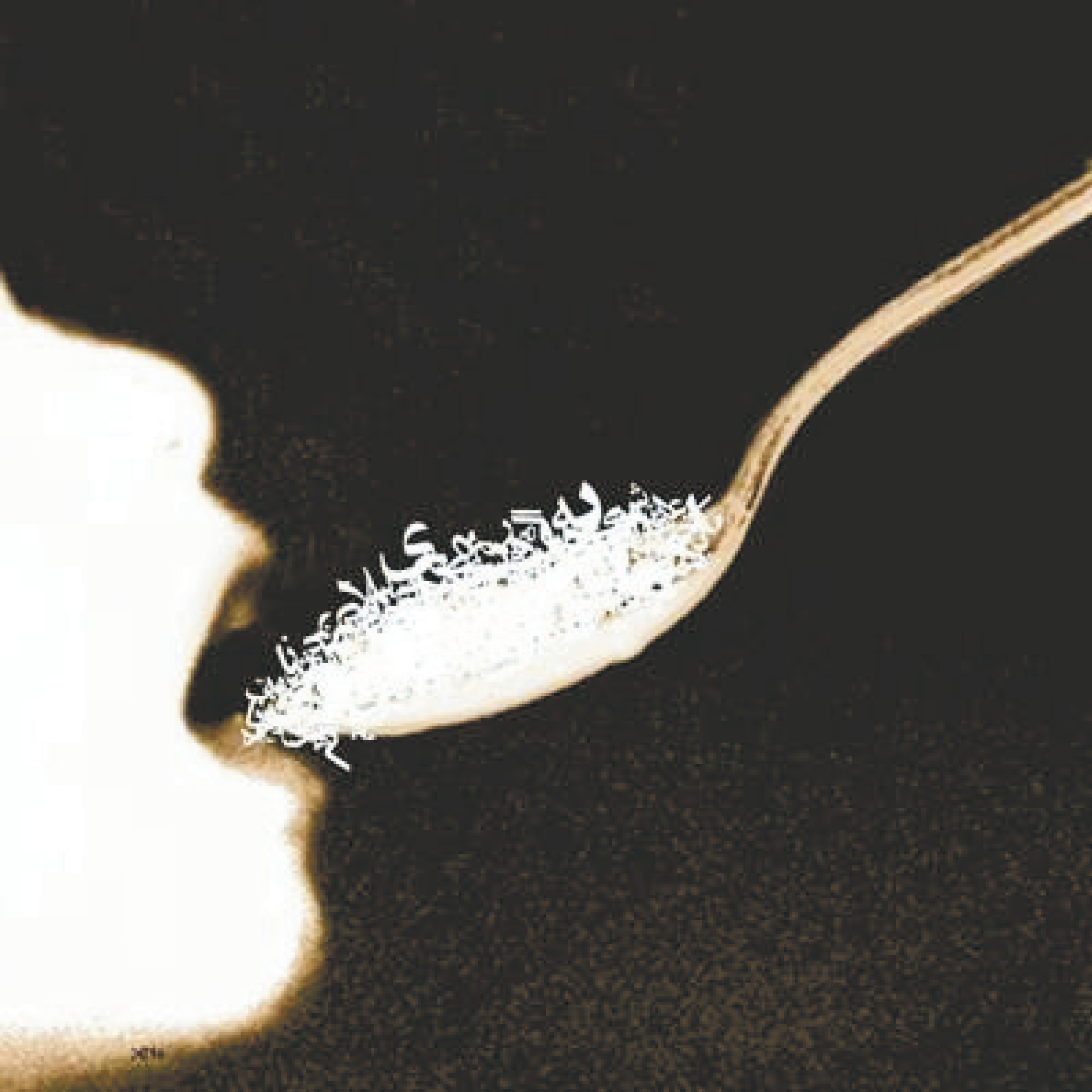
El Alimento de Behrang Samadzadegan